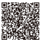
↑ App Store