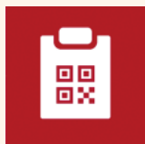
↑ 新型コロナワクチン接種証明書アプリ

★ 新型コロナワクチンの接種証明書 がデジタル化され、スマートフォンアプリで発行、確認できます。 *申請にあたってはマイナンバーカードが必要です。