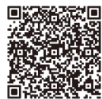
↑ Google Play