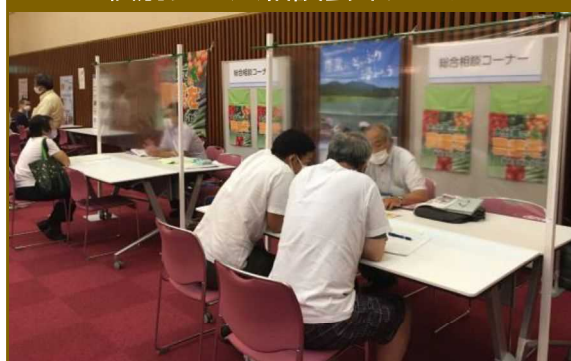
個別ブース相談会イメージ

自社の業務内容や作物へのこだわり、採用したい人物像などを、農業高校生等にPRしてみませんか？