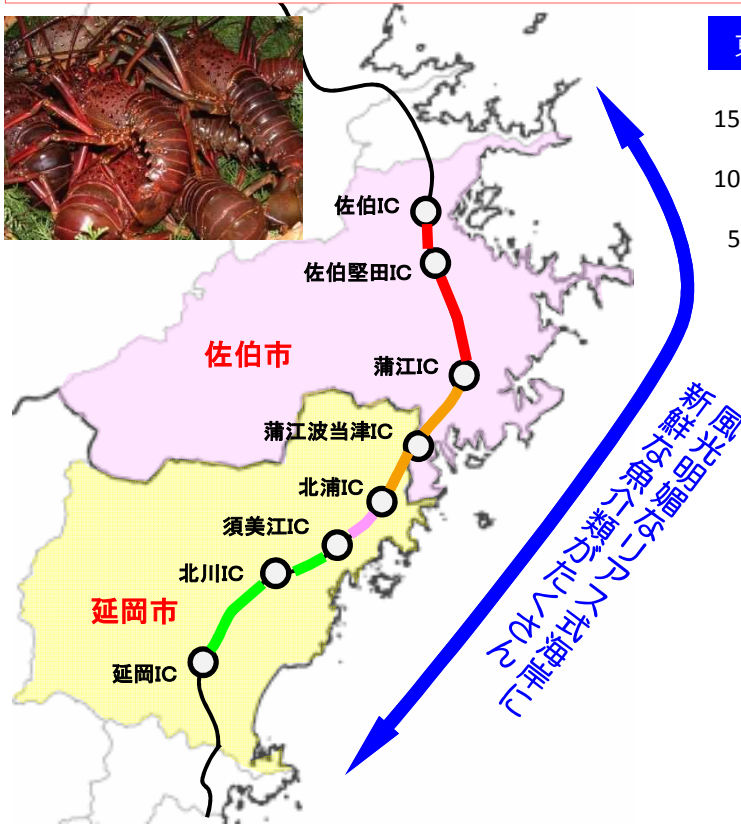
東九州伊勢えび海道・伊勢えび祭りの売上げが増加