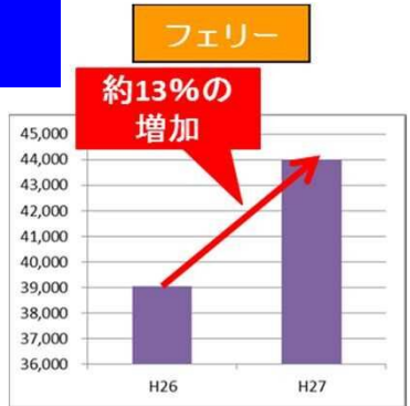
・関西や四国等へ向かう県内フェリー7航路の県内上陸者数が13%の増加