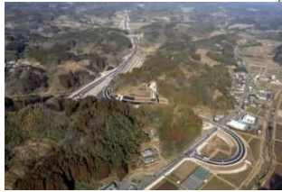
○中九州横断道路(大野～朝地間:H27.2開通)