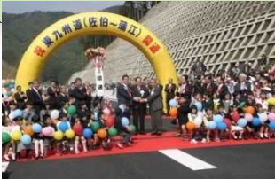
○東九州自動車道(佐伯～蒲江間:H27.3開通)