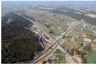
○東九州自動車道(豊前～宇佐間:H27.3開通) ○中津日田道路(東九州道～中津港直結:H27.3開通)