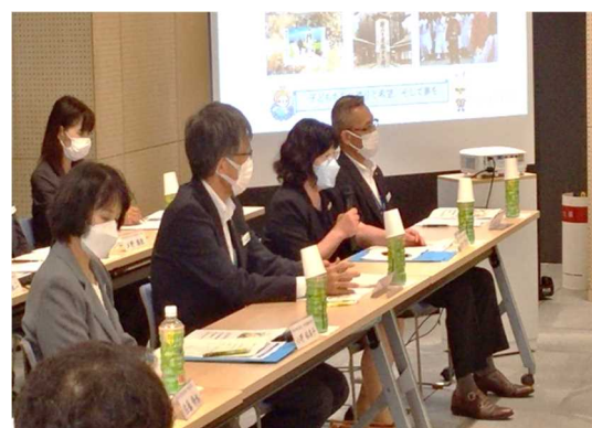
目標協働達成は、学校・家庭・地域で目的を共有する必要性について発言（宇佐市教育委員）