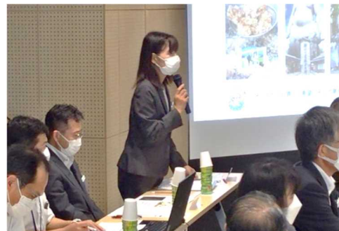
「協働的な学び」がつなぐ学力向上の取組を説明（宇佐市教育委員会 都課長）