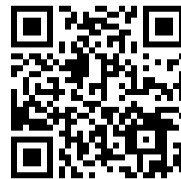
自動昇降式観測機QRコード

*警戒密度は漁業被害が想定される密度です。 *アワビ、ササエ等ではカレニア・ミキモイで100～200細胞/mlで斃死する可能性があります。 *マグロに関しては、赤潮注意・警戒密度に1/10を乗じた細胞密度とします。