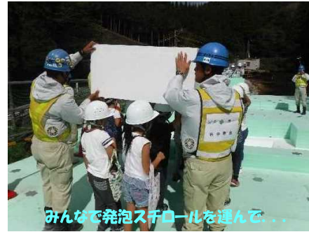
みんなで発砲スチロールを運んで...