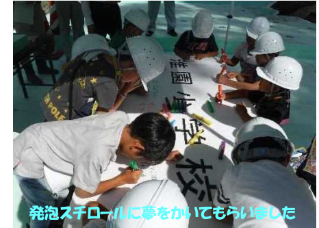
発砲スチロールに夢をかいてもらいました