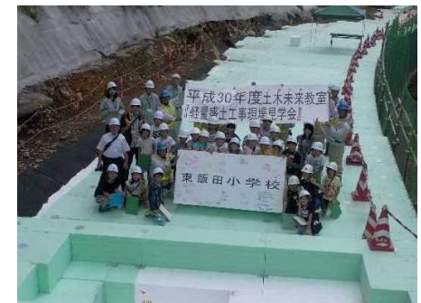
東飯田小学校の皆さん