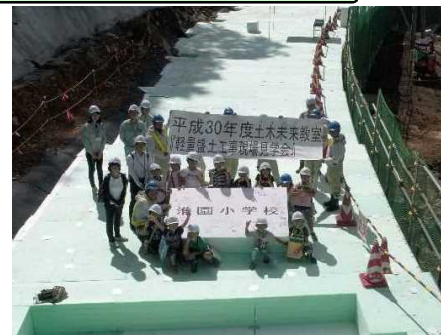
淮園小学校の皆さん