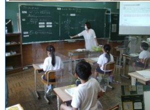
学習補助員の授業