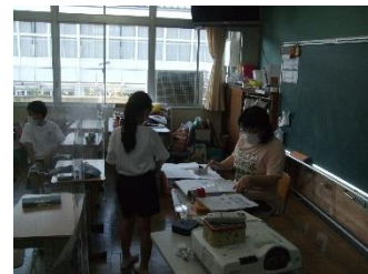
学習がんばり週間チェック表の指導