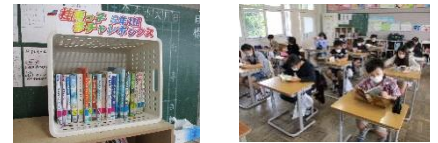
おななうさぎ「読み聞かせ」の取組