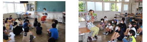
「学びの21世紀塾」への積極的参加