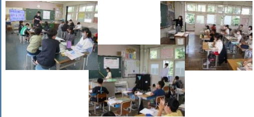
4・6年社会「地域人材活用授業」