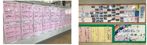
5年「国語・算数・理科教科担任授業」