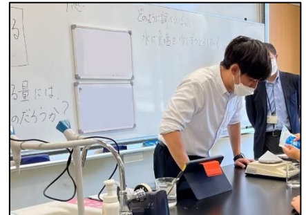
NO.284 2022年10月 大分市立竹中中学校二豊学園分校