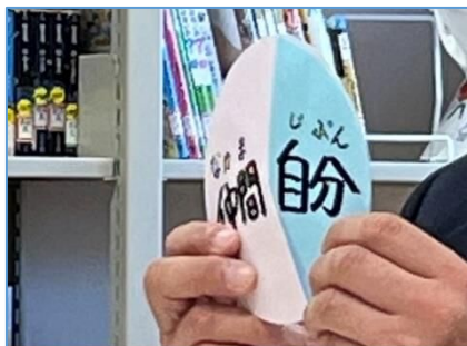
NO.285 2022年10月 大分市立竹中中学校二豊学園分校