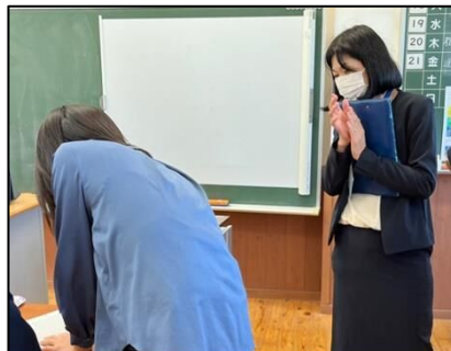
NO.283 2022年10月 大分市立竹中中学校二豊学園分校