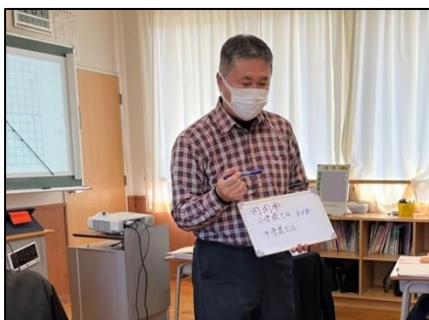
NO.282 2022年10月 大分市立竹中中学校二豊学園分校