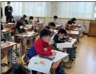
NO.326 2022年10月 大分市立東植田小学校