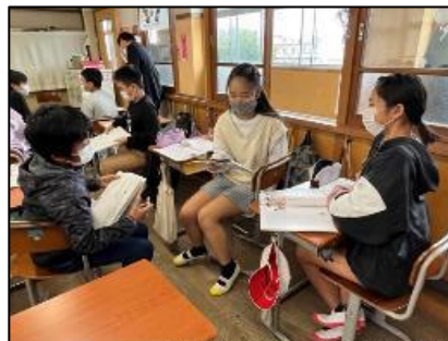
NO.327 2022年10月 大分市立東植田小学校

今日の「めあて」を確認する。 自分の思いを書いてみる。 みんなと共に学ぶために。