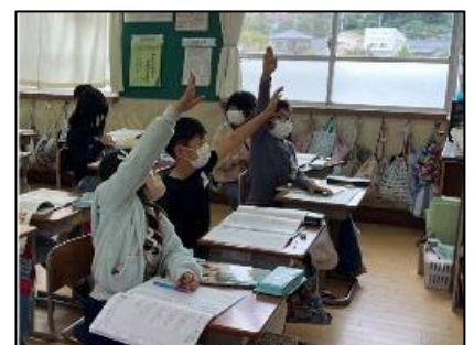
NO.325 2022年10月 大分市立東植田小学校

「私と同じだね」「それもあるよね」「気がつかなかった」・・・ 否定しないから学びが深まる。