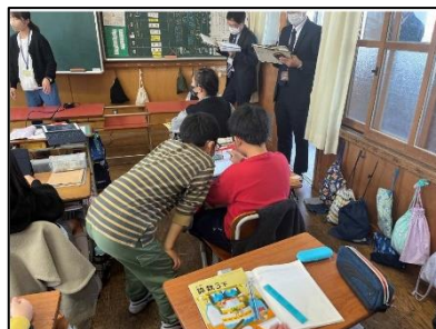
NO.485 2022年11月 大分市立下郡小学校

タブレットは検索したり、友達のことを知るための道具。学び合い高め合うのは私たちが。