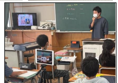
NO.486 2022年11月 大分市立下郡小学校