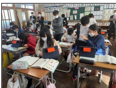
NO.487 2022年11月 大分市立下郡小学校

教室にいないでも、相手はどんなことを考えているのか、お互い想像することで、つながっている。