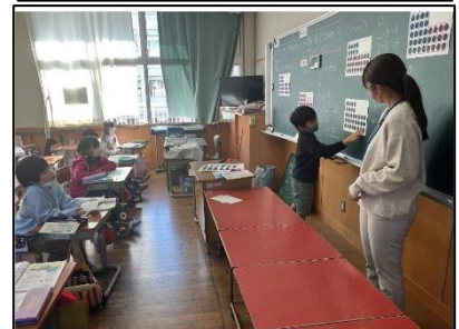
NO.488 2022年11月 大分市立下郡小学校