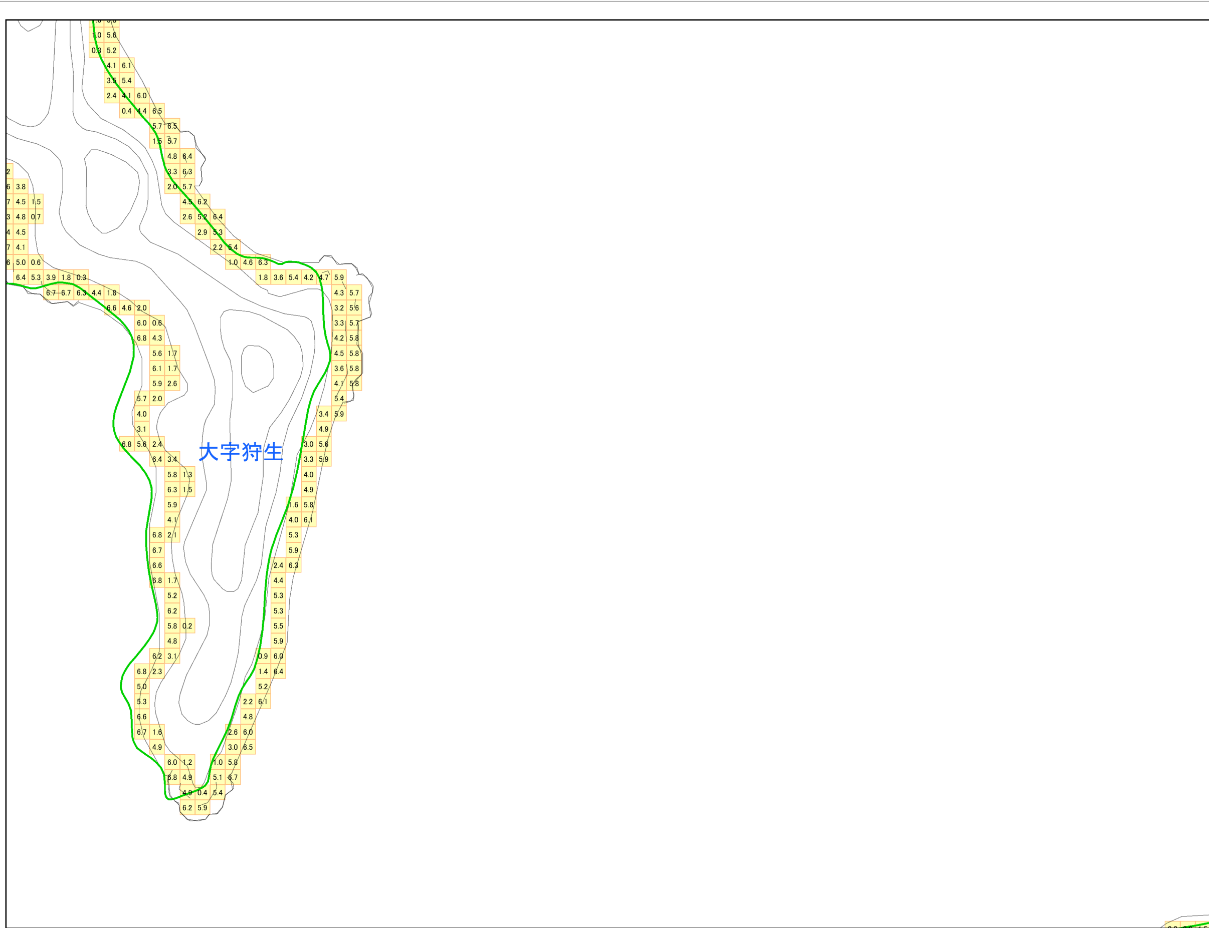
津波災害警戒区域 区域図