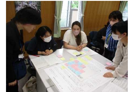
小学校以降につながる資質・能力について協議

【参加園】八幡幼稚園、渡町台幼稚園、松浦幼稚園、佐伯幼稚園、鶴岡幼稚園、つるおか保育所、八幡保育園、長島保育園、松浦保育園、さくら保育園、畑野浦保育所、やよいこども園、認定こども園カトリック佐伯幼稚園、ルンビニコども園、みなみこども園、さいきこども園、かまえこども園、うめこども園、ほんじょうこども園、なおかわこども園、ながと保育園、みのり幼稚園、しろやま共同保育園