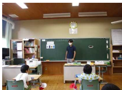
ひき算場面がイメージできる工夫を行い、ブロックを使いながら ひき算場面を言葉で表現する