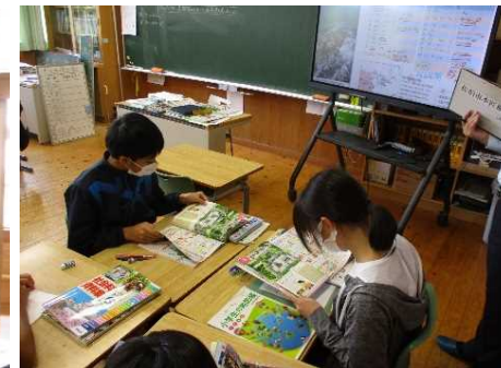
課題の解決に向けて 協働して情報を取り出す