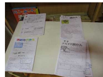
学びの成果物を 展示して共有