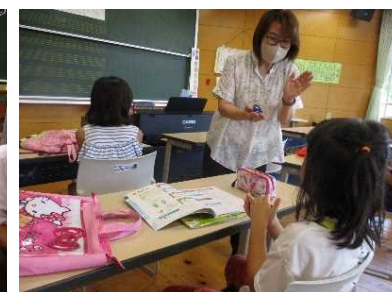
個の実態に応じて リズム打ちを一人ひとりを行う