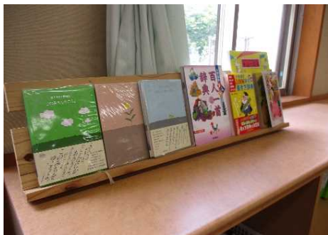
心を耕す読書環境