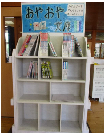
PTA研修部による読書環境