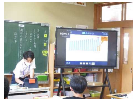
身近なものとして捉えることができるように 実際のデータを提示