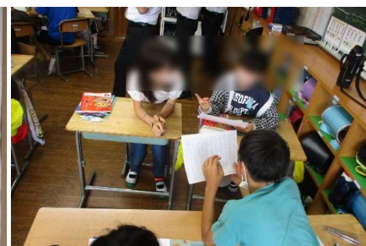
読書月間に合わせた環境づくり、目標の設定