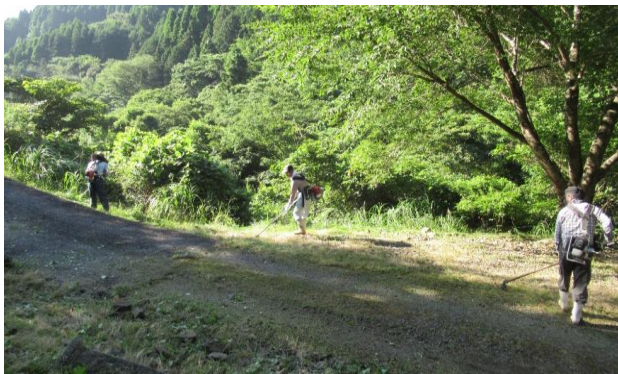
作業中 (駐車場入口)