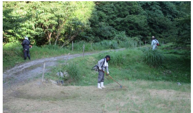
作業中 (第一駐車場)