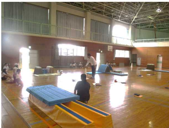
場づくりの工夫 (自分で場を選択する)