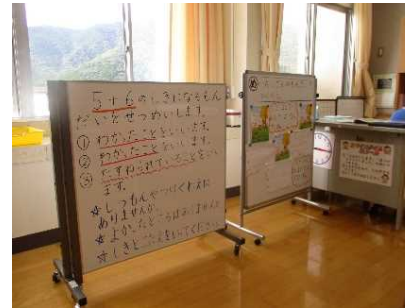
式にあう問題場面をつくるために必要な情報を明示