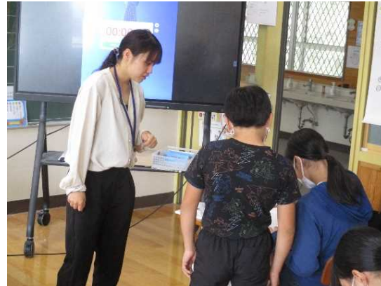
自分の学びの状態を意志表示して自力解決する場面と、協働的な学びの場面の組み合わせ