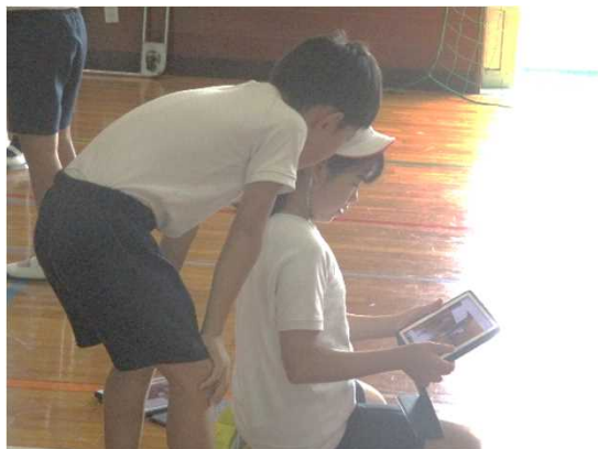
端末で自分の技を録画して状態を確認したり、気づきを伝え合ったりする