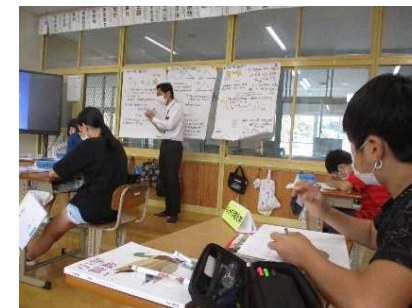
前時のノートや掲示物から考えをつくるための情報を取り出す