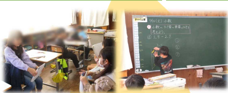
自分の考えを友だちに説明したり、黒板に書いたりして共有する

各教科や領域の学習において生活場面とのつながりを考え、自己の成長を感じられるようなアウトプットをする場の設定