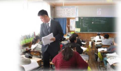
中心発問に対して自分の考えを書く、教師は子どもの考えを把握する