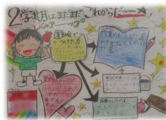
自分たちに付いた力を自覚し、各教科等の学びに生かす