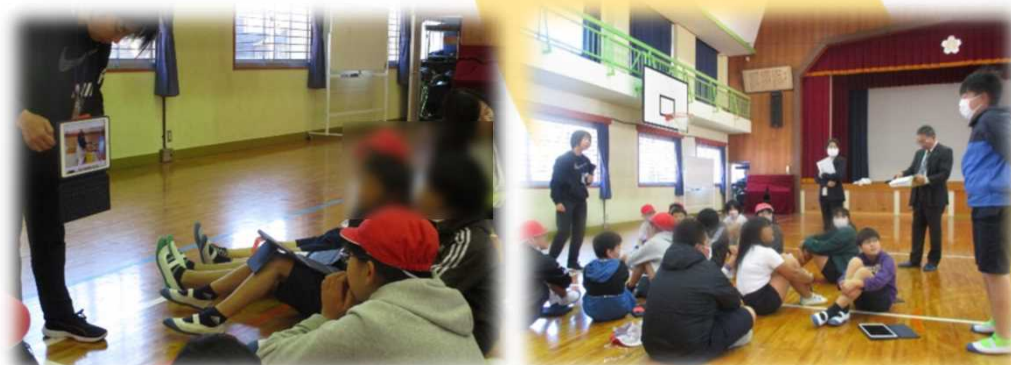
運動のコツやポイントを動画で確認したり、友だちの運動のよさについて振り返ったりして、次の時間の見直しをもつ