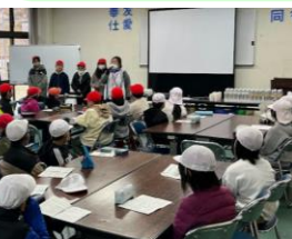
ステップ③ 森づくりを体験する活動