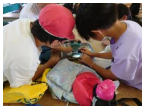
ステップ② 森を学び理解する活動