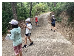
ステップ① 森に触れ親しむ活動