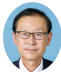
大分県議会副議長 井上 いのうえ 明夫 あきお