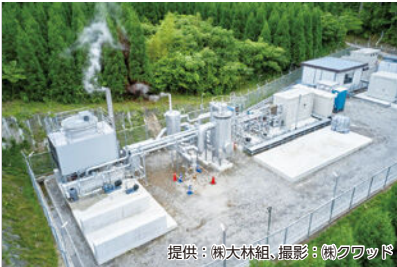
地熱発電によるグリーン水素製造装置（九重町）

水素については、「グリーン・コンピナートおおいた推進構想」の実現に向け、水素の供給や利活用に関する対策を進めます。また、燃料電池車両の導入支援などを行い、大分県版水素サプ