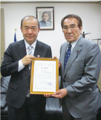
4月23日の災害見舞金贈呈の様子