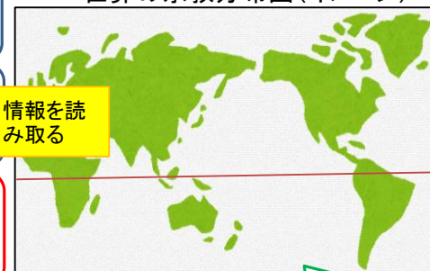
世界の宗教分布図(イメージ)

実際の場面ではキリスト教、仏教、イスラム教、ヒンドゥー教の分布がわかる地図を使用する。