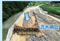
小野川(日田市)の流木捕捉(R5梅雨前線豪雨)