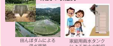
田んぼダムによる洪水調節 家庭用雨水タンクによる雨水の貯留