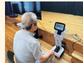
アバターロボットを使った避難者支援