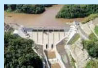
玉来ダムの効果(R4台風14号)