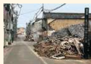
能登半島地震による被害状況