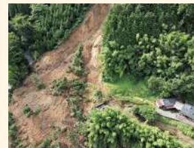
ドローンによる被災箇所調査

加えて、AIによる災害情報の収集・解析やアバターロボットによる避難所支援のほか、衛星データの活用の検討を進めており、先端技術を活用して防災対策を高度化させ、災害対応の迅速化・適切化を図っていきます。