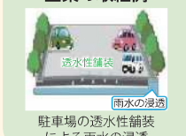
駐車場の透水性舗装による雨水の浸透