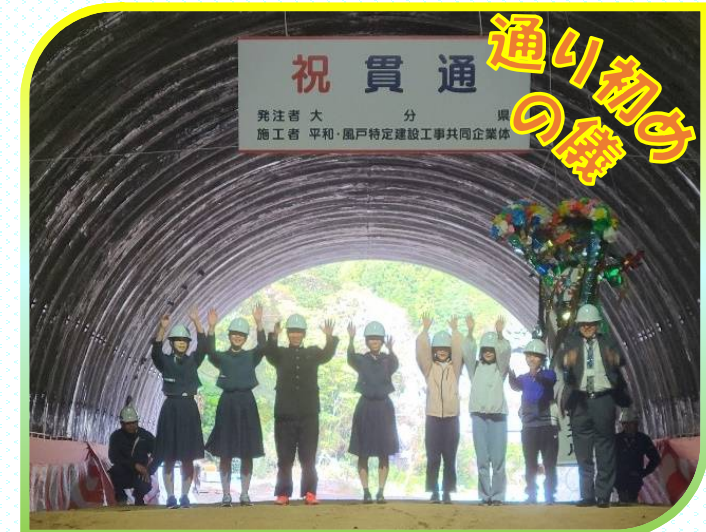
地元の児童・生徒の皆さんで万歳！