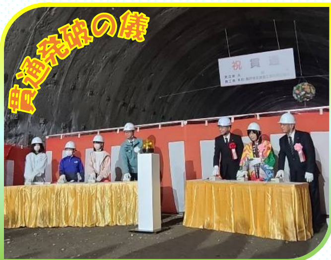
点火ボタンを押して“発破”開始