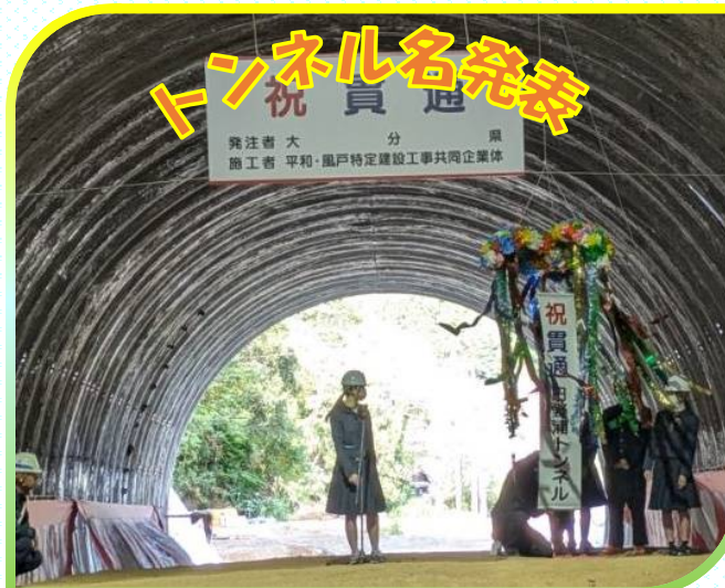
トンネル名は日野浦トンネルです！