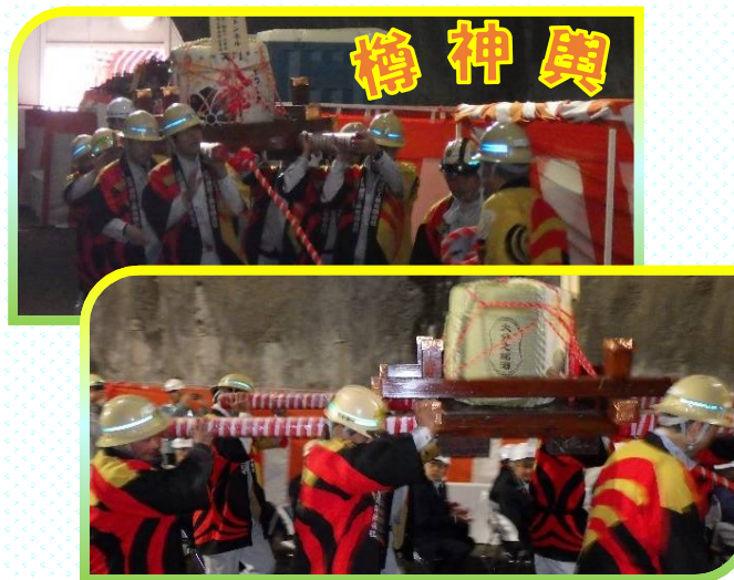
わっしょい！わっしょい！