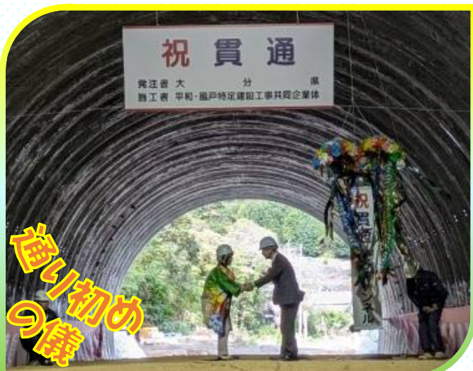
佐伯市長と佐伯土木事務所長