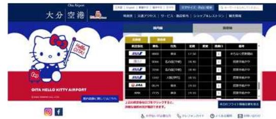
【大分空港ホームページトップ画面】