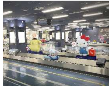
【国内線手荷物受取所】