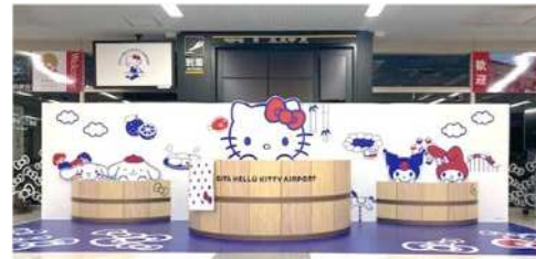
【1階到着ロビーフォトスポット】