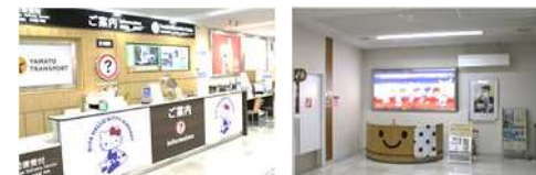
【案内所カウンター・到着ロビー電照看板】