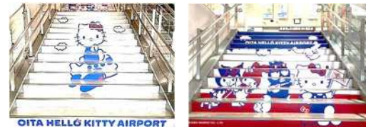
【国内線ビル中央階段】