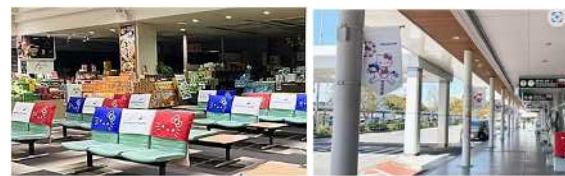
【2階出発ロビー椅子カバー・ビル前面フラッグ】