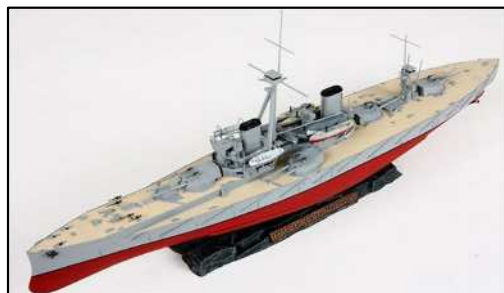
ドレッドノート(1/100) 英国ポーツマス 全長:161cm、幅:25cm、高さ:45cm