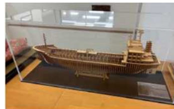
船舶の骨格模型(下ノ江造船)