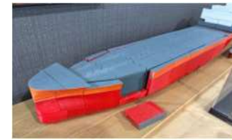
パズル模型(臼杵造船)