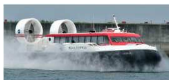
旧ホーバー(三井造船)