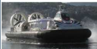
新ホーバー(英国製)