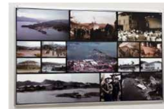
造船の歴史写真パネル