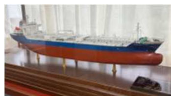
タンカー模型(南日本造船)