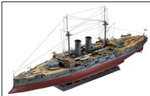
戦艦三笠(1/400) 英国バロー 全長:33cm、幅:6cm、高さ:18cm