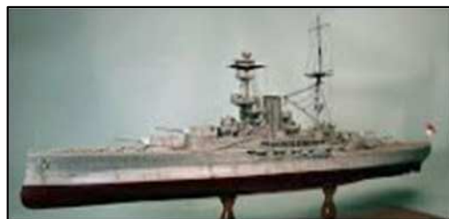
ロイヤルソプリン(1/100) 英国ポーツマス 全長:189cm、幅:31cm、高さ:50cm