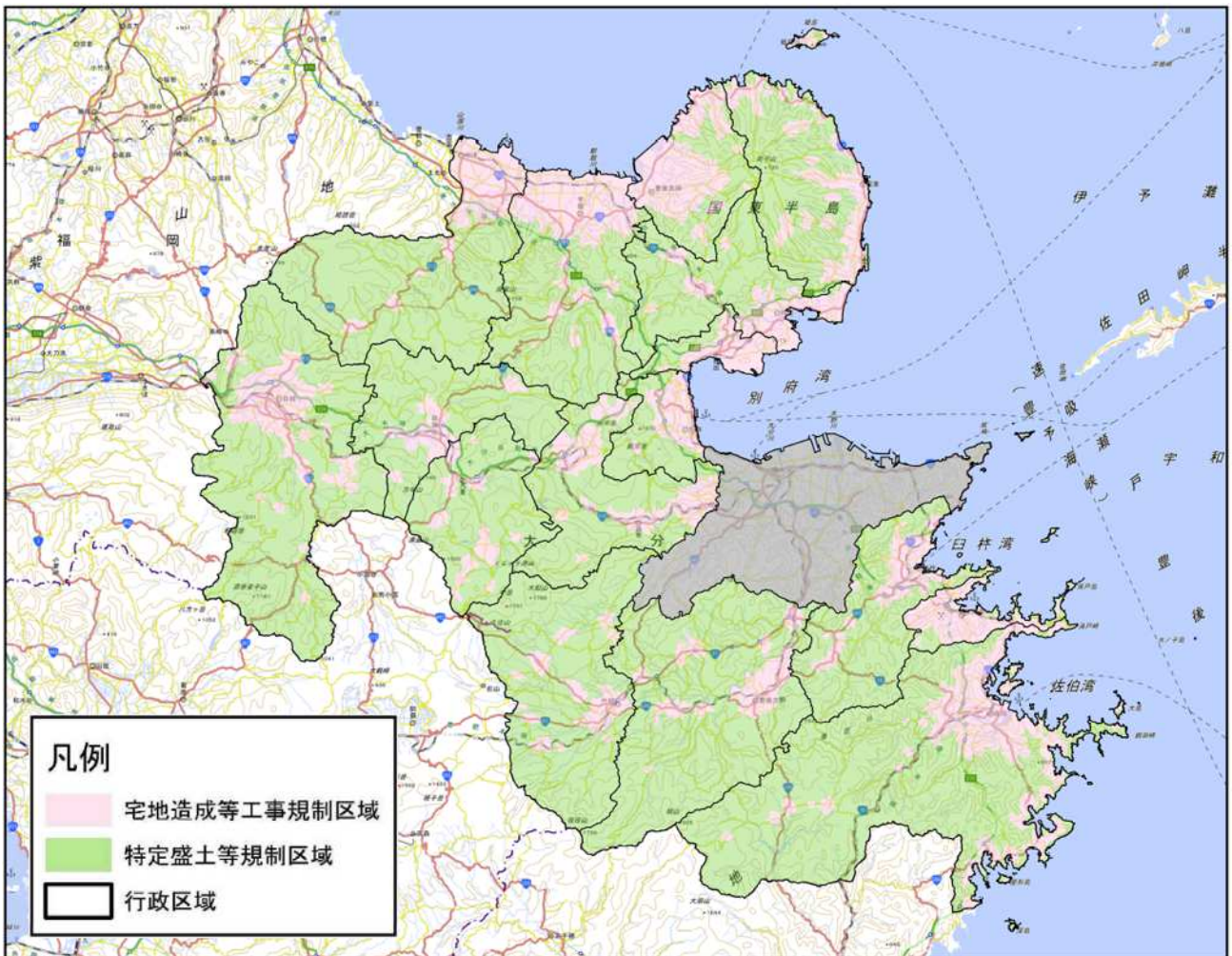
図30 大分県の「宅地造成等工事規制区域」及び「特定盛土等規制区域」（大分市を除く）