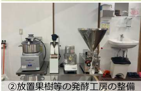
②放置果樹等の発酵工房の整備