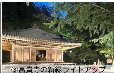
③富貴寺の新緑ライトアップ