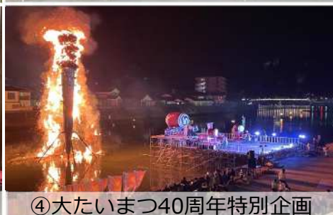
④大たいまつ40周年特別企画