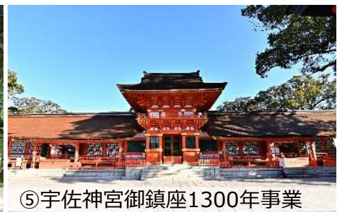
⑤宇佐神宮御鎮座1300年事業