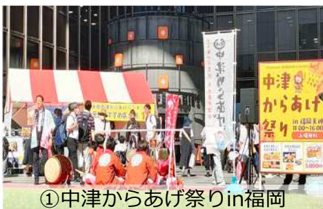
①中津からあげ祭りin福岡