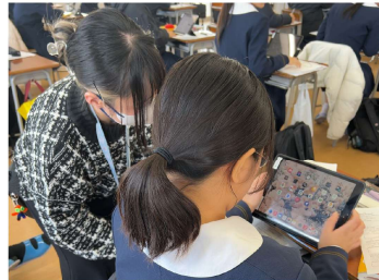
授業で生徒を支援する様子