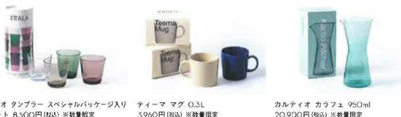
カルティオ タンブラー スペシャルパッケージ入り 4個セット 8,500円(税込) ※数量限定 ティーマ マグ 0.3L 3,960円(税込) ※数量限定 カルティオ カラフェ 950ml 20,900円(税込) ※数量限定