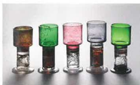
カイ・フランク 《KF486》ゴブレット 1969年 ヌータヤルヴィ・ガラス製作所