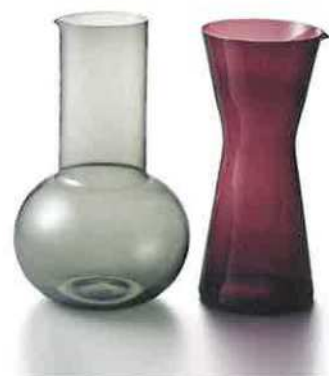
カイ・フランク 《162》(左) 1955年、《1610》(右) 1954年 カラフェ メーカー ヴィ・ガラス製作所

本展はヘルシンキ建築&デザイン・ミュージアムのコレクションを中心に、ガラス器、陶磁器などの代表作、ファブリック、スケッチ、写真や映像250点以上を展示。初期から晩年までの作品と仕事の全貌を明らかにします。また日本の文化に惹かれ、3回の来日を果たしたフランクの足跡や、彼に影響を受けたデザイナーらの作品も紹介します。時代を超えて今なお愛されるカイ・フランクの作品と、彼のデザインを支える思想に迫る大回顧展です。