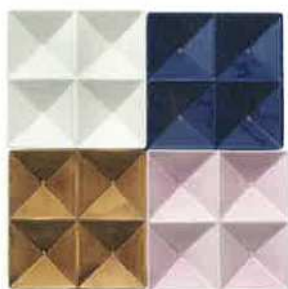
カイ・フランク 《KF1》 サービングプレート 1957年 アラビア製陶所