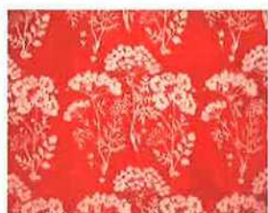
カイ・フランク 《ブトウキノトコ(セリ草の谷間)》[複製] プリント生地 1948年(オリジナル) アルテック