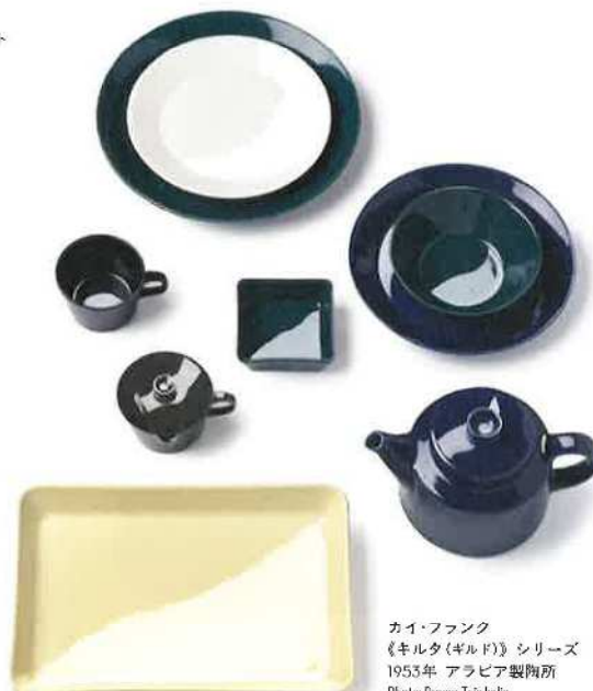
カイ・フランク 《キルタ(キルド)》シリーズ 1953年 アラビア製陶所 Photo: Rauno Traskelin

表面右下: アラビア製陶所でのカイ・フランク 1953年 Photo: Pietinen ©Architecture & Design Museum Helsinki 表面作品切り抜き: カイ・フランク 《1610》カラフェ 1954年、《キマラ(カクテル)》[2744] タンブラー 1953年 撮影: 鈴木剛介