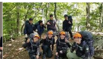
山岳部インターハイ