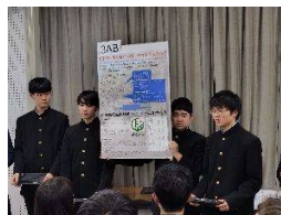
総合的な探究発表会

1年：応用・標準クラス 2年：文系コース・数理コース(各習熟度別クラス) 3年：文Ⅰ(就職・公務員) 文Ⅱ(私立大・短大・専門学校) 文Ⅲ(国公立大文系) 数理(国公立大理系・私立大理系)