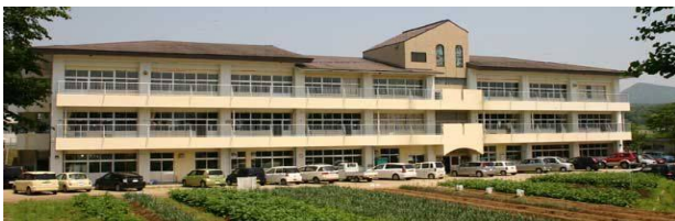
～広々とした農場から望む高等部棟～

昭和40年 4月 臼杵市立臼杵養護学校開設 (福良ヶ丘小学校内) 昭和54年 4月 県立移管により「大分県立臼杵養護学校」として発足 同時に佐伯分校を開設 昭和60年 4月 臼杵市井村(現在地)に移転 津久見養護学校を統合 平成6年 4月 高等部設置 平成17年 4月 佐伯養護学校並びに竹田養護学校 に本校の高等部分教室を設置 平成22年 4月 校名を「大分県立臼杵支援学校」 に変更 平成28年 10月 創立50周年記念式典挙行 平成31年 3月 スクールバス更新(2台) 令和2年 9月 体育館大規模改修 令和3年 1月 教室棟大規模改修