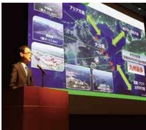
企業立地セミナー

豊肥地区での半導体関連企業の誘致加速に向け、市と一体になって千歳IC付近の産業用地の整備や誘致活動に取り組んでいます。また、昨年12月には東京で企業立地セミナーを開催し、県内の魅