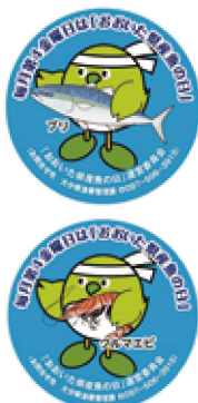
おおいた県産魚の日 オリジナル缶バッジ