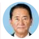
日本共産党 堤 栄三 議員