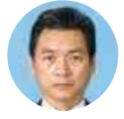
自由民主党 宮成 公一郎 議員