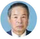
自由民主党 小川 克己 議員