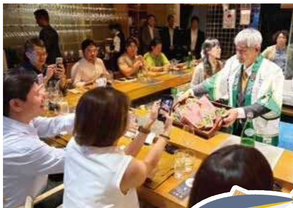
シンガポールでのメニューフェア