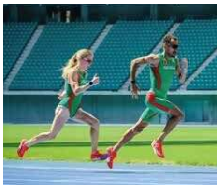
クラサドームで練習を行う世界陸上ポルトガル代表の選手

サッカー、ラグビーのW杯会場となったほか、世界陸上で活躍したポルトガル代表チームの合宿などでも利用されるなど、多くの実績を重ねています。