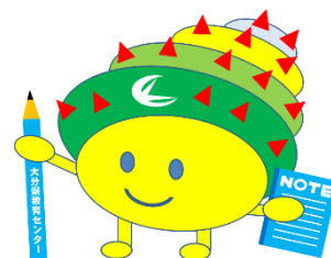
大分県教育センターイメージキャラクター 『ヤリガイくん』