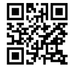
あるとっく ホームページ

職場の仲間でグループ登録をすると、メンバーの歩数がわかるので、励みになり、職場での話題にもつながります。歩くことはもちろん、県内各地で開催されるミッションに参加するなど、職場ぐるみの健康づくりにぜひお役立てください。