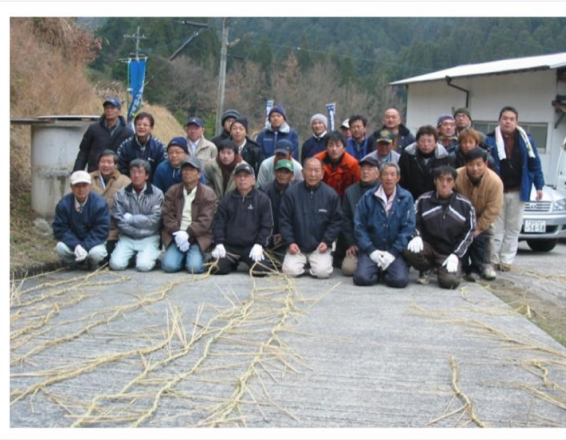
12団体から31人が応援に