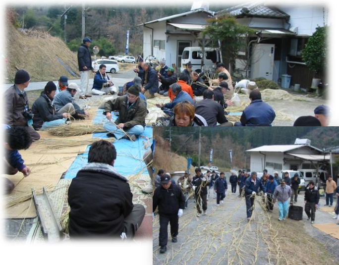
大変な作業でした

初めての経験! 「しめ縄づくり」に悪戦苦闘? 何とか360疋分を作り上げました。