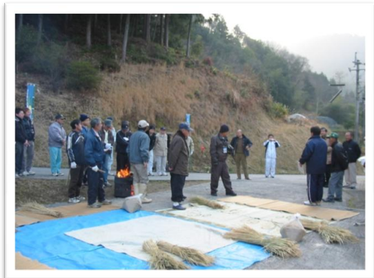
朝の挨拶、注意事項説明