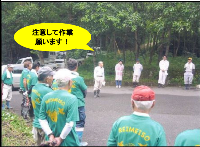
朝の挨拶、注意事項説明