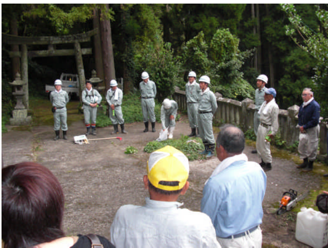
顔合わせ、作業説明等