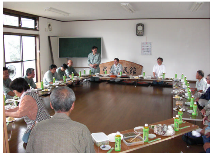
昼食・自己紹介等