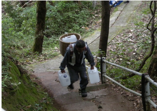
水の運搬（これがキツイ！）