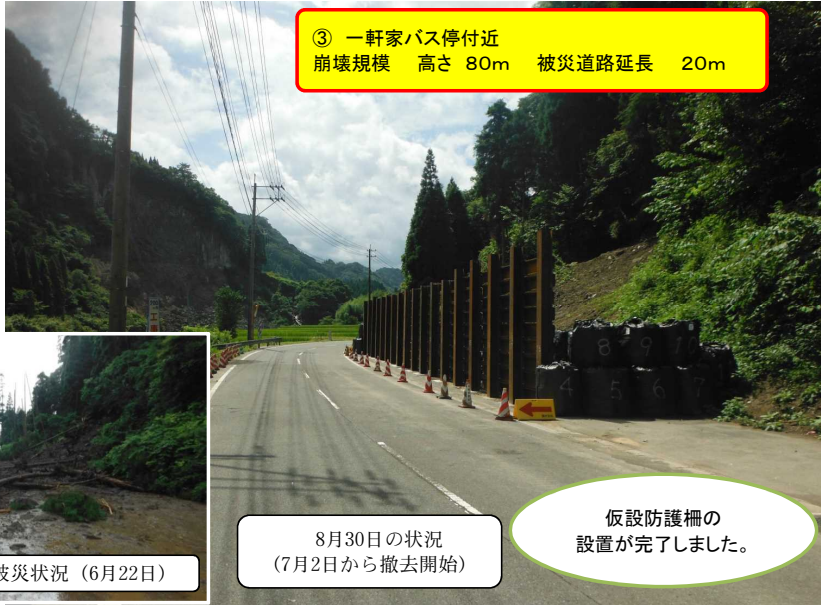
③ 一軒家バス停付近 崩壊規模 高さ 80m 被災道路延長 20m