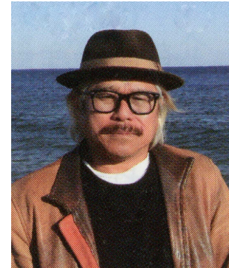
写真家 黒木 一明 氏

今回選ばれた作品たちが、未来に向かってこれから果たしていく役割は非常に大きいと確信しています。