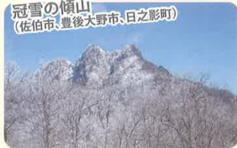
冠雪の傾山 (佐伯市、豊後大野市、日之影町)

冬、祖母・傾・大崩山系は、きらめく霧氷や雪に覆われ、静かな白銀の世界が広がります。