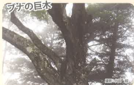
様々な植生の垂直分布が見られる祖母・傾・大崩山系の奥山では、このようなブナの巨木も見られます。