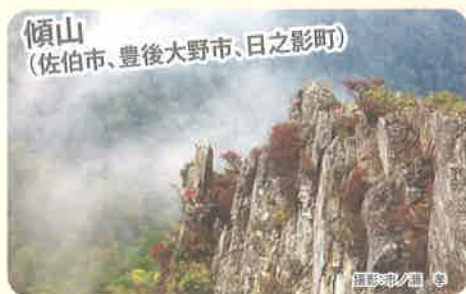
傾山 (佐伯市、豊後大野市、日之影町)