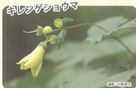
祖母・傾・大崩山系の限られた地域にのみ生育するソハヤキ要素の植物です。