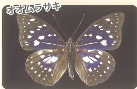
絶滅が危惧されているオオムラサキは、鮮やかな色合いが特徴で日本の国蝶にもなっています。