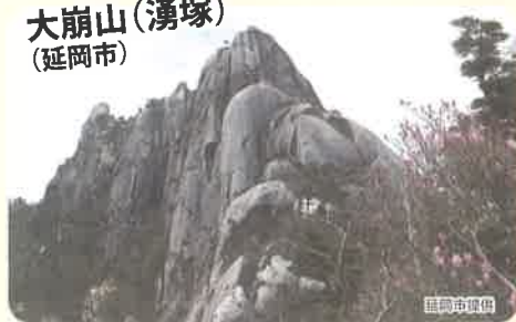
大崩山(湧塚) (延岡市)