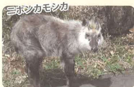
国指定特別天然記念物。日本固有種で九州地域では絶滅が危惧されています。

※ソハヤキ要素：日本列島のうち、古くから陸地であった紀伊、四国、九州の山地帯に共通して分布する日本固有種のこと。