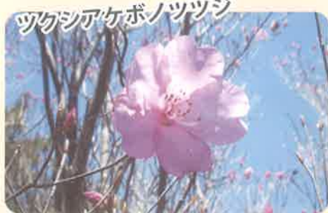
標高1,000m以上の高山で見られる九州特産種で、春には多くの登山者を魅了します。