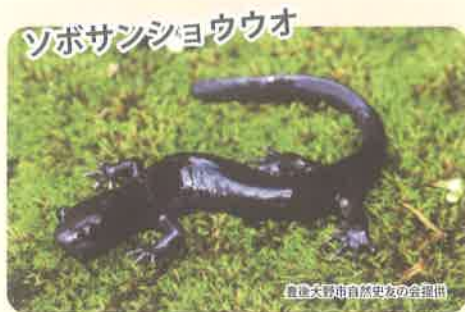
祖母・傾・大崩山系の溪流にのみ生息する固有種で、2014年に新種として記載されました。