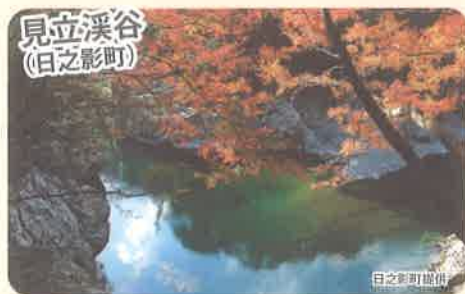
見立渓谷 (日之影町)