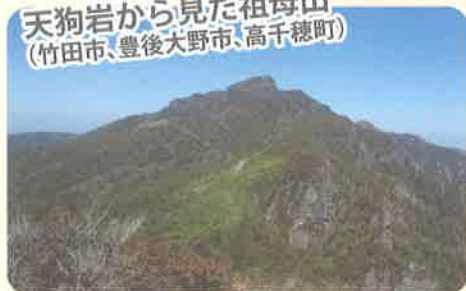
天狗岩から見た祖母山 (竹田市、豊後大野市、高千穂町)

鋭く尖った稜線や岩壁など荒々しい姿を持つ祖母山は、地域の人々の畏敬の念も集めてきました。