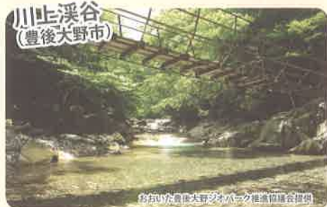
川上渓谷 (豊後大野市)

鋭く尖った稜線や岩壁など荒々しい姿を持つ祖母山は、地域の人々の畏敬の念も集めてきました。