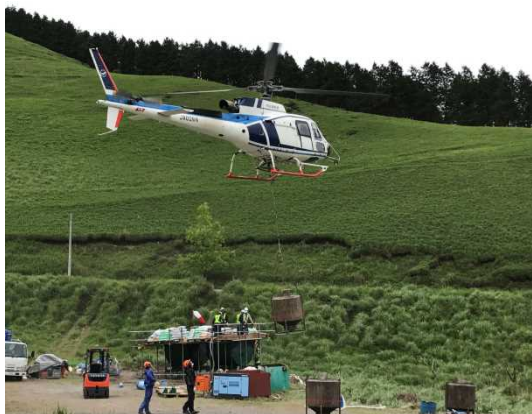
ホバリング状態でバケットへ種子・緑化基盤材等を搭載し、散布に向かうヘリコプター