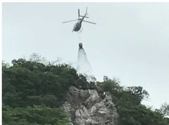
種子・緑化基盤材等の崩壊地への散布状況