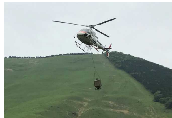
散布を終え、ヘリポートへ帰投中の状況