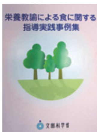
栄養教諭による食に関する指導 実践事例集 平成21年3月 文部科学省