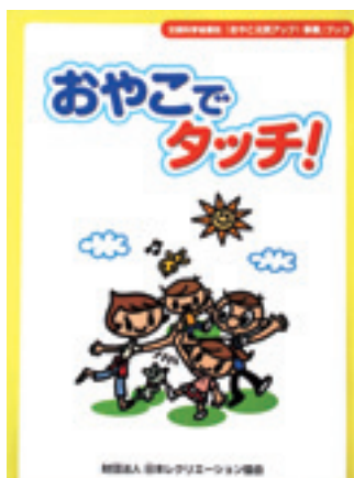
「おやこ元気アップ! 事業」ブック おやこでタッチ! 平成21年7月 (財)日本レクリエーション協会