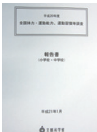
平成20年度全国体力・運動 能力、運動習慣等調査報告書 平成21年1月 文部科学省