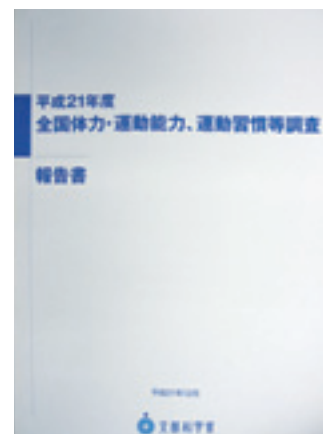
平成21年度全国体力・運動 能力、運動習慣等調査報告書 平成21年12月 文部科学省

◇ スポーツ振興基本計画 (文部科学省) 平成12年9月 [平成18年9月一部改訂]