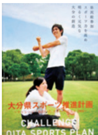
大分県スポーツ推進計画 ~チャレンジ! おおいた スポーツプラン2009~ 平成21年3月 大分県教育委員会