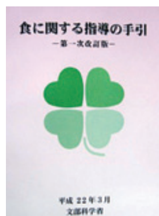
食に関する指導の手引 —第一改訂版— 平成22年3月 文部科学省

◇ 食育基本法 [平成17年7月] と 食育推進基本計画 [平成18年3月] 《アドレス》 http://www8.cao.go.jp/syokuiku/about/index.html