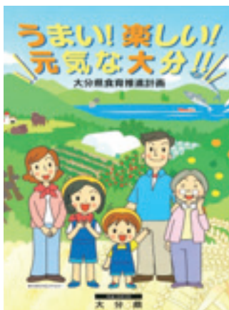
うまい! 楽しい! 元気な大分!! 大分県食育推進計画 平成18年3月 大分県

参考資料（検索ツール）として、体力向上に関する必要な情報を入手するための資料やホームページ等を紹介していますので、先生方の実践や研修、保護者への啓発等にご活用ください。