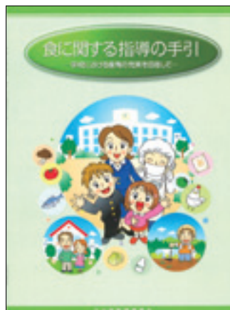
食に関する指導の手引き —学校における食育の充実を目指して— 平成18年5月 大分県教育委員会