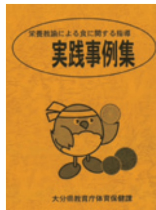
栄養教諭による食に関する指導 実践事例集 平成21年10月 大分県教育庁体育保健課