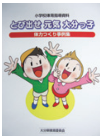
小学校体育指導資料 とび出せ元気大分っ子 体力づくり事例集 平成16年3月 大分県教育委員会