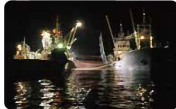
まき網漁業 (夜間、光で魚を集めて大きな網で囲い、漁獲する)