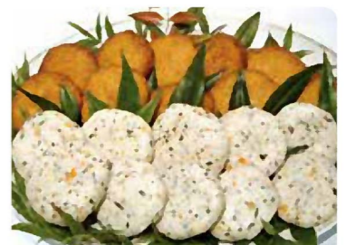
じゃこ天(すり身天)

県立海洋科学高校ではすり身に野菜をたっぷり加えて、歯ごたえ抜群の「おさかな小判」を開発しています。