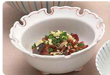
さばのりゅうきゅう

様々な調理法があるが、大分では刺身でも食べるのが特徴。秋から冬にかけて一段と脂がのって旨味が増してくる。