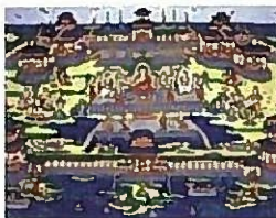
阿弥陀浄土壁画復元▶

国宝富貴寺大堂の阿弥陀堂建築や壁画など、六郷山寺院の中でも特異な富貴寺の世界を紹介します。