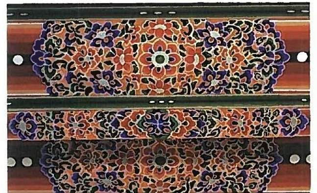
▲富貴寺内障長押文様(復元)

プロジェクションマッピングの運用開始にあわせ、富貴寺と熊野磨崖仏の関連資料やそれらを取りまく時代背景などを紹介します。