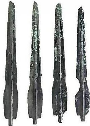
▲浜遺跡出土銅剣(京都国立博物館蔵)

弥生時代から古墳時代のおおいたの様相を国指定重要文化財大分県吹上遺跡出土品(日田市教育委員会蔵)と国指定重要文化財大分県免ヶ平古墳出土品(大分県立歴史博物館蔵)を中心に紹介します。