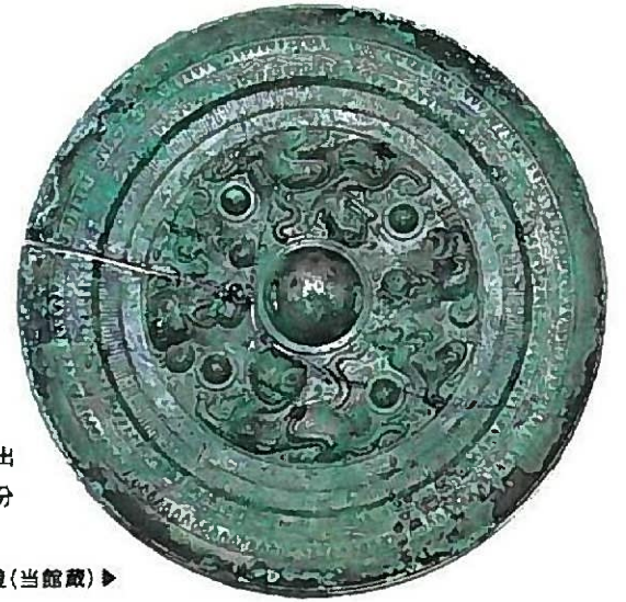
免ヶ平古墳出土斜縁二神二獣鏡(当館蔵)▶