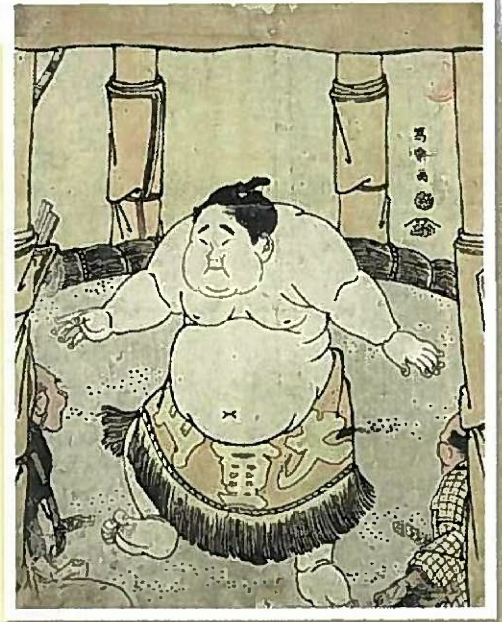
大倉山文五郎二入土俵入りの図(相撲博物館蔵)◀

宇佐神宮「放生会」の起源とされる「単人の乱」から1300年とされる節目の年に合わせ、「放生会」で行われる神事としての相撲に注目し、神事相撲から現代まで続く相撲の歴史の変遷やその時代を彩った名力士の関連資料を一堂に集め、展示します。古文書や番付・錦絵・絵画等の資料をはじめ、名力士が使用した化粧箱や刀・衣装等に至るまで、貴重な資料より相撲の歴史の深さや面白さ、また相撲文化の美しさに迫っていきます。