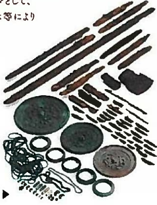
国指定重要文化財 大分県免ヶ平古墳出土品▶

先史時代から古墳時代の人々の暮らしの様子を、生・死・いのりというキーワードにより紹介します。