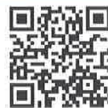
商工会連合会 ホームページ

現在、女性の経営指導員が7人在籍しており、そのうち4人が過去2年以内に採用されています。女性ならではの感性や視点等を活かした細やかな支援は大変喜ばれており、着実に成果をあげています。これからも女性経営指導員の活躍を期待するとともに、女性がやりがいを持ち、働きやすい職場づくりに取組んでいきます。