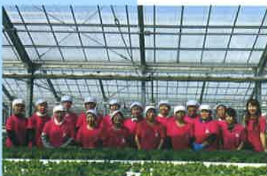
農業で活躍している女性たち