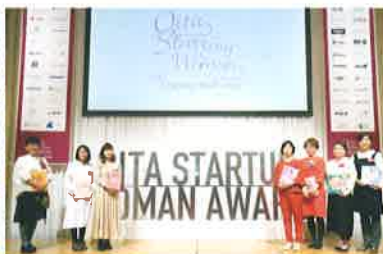
女性のスタートアップアワード