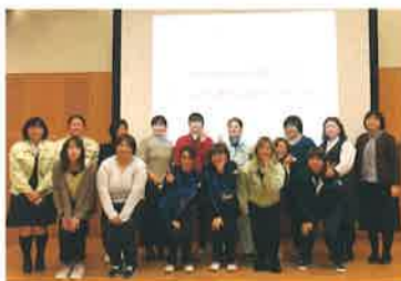
建設産業で活躍する女性達