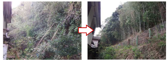
急傾斜地の立木撤去