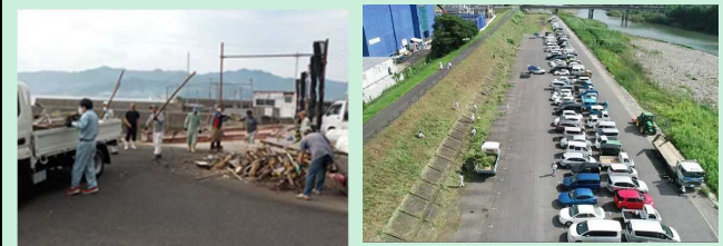
海の日清掃活動 (臼杵港・下ノ江港)