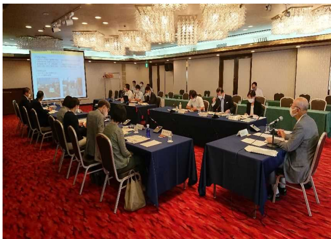
事業評価監視委員会の状況

令和2年度の事業評価監視委員会では、土木建築部、農林水産部あわせて事前評価対象10事業、再評価対象22事業、事後評価対象1事業の計33事業が審議され、各々の対応方針案について「妥当」であるとの審議結果が知事あてに答申されました。