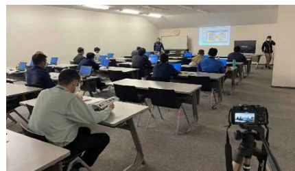
体験会（3次元設計データ作成）

本県においても、平成29年度からICT活用工事を試行しており、令和2年度は、ICTを活用できる人材を育成するため、オンラインセミナーや体験会を開催し、普及拡大に取り組んでいます。