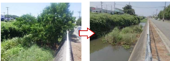
河川内の支障木伐採

土木事務所では、災害発生時などに迅速な対応ができるよう、日頃から防災資機材を備蓄するなど地域防災力の向上に努めます。また、防災や生活環境の保全等を図るため、河川等の支障木伐採や管理道の修繕等を行います。