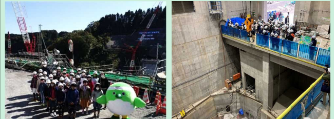
玉来ダム現場見学 (竹田市立豊岡小学校)