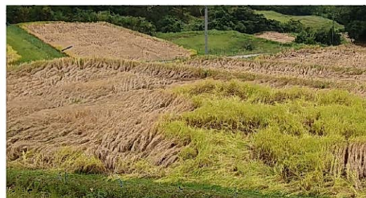
トビイロウンカによる坪枯れ