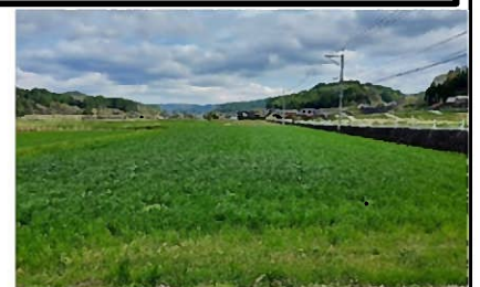
ドローンによるイタリアンライグラス稲立毛間播種実証結果