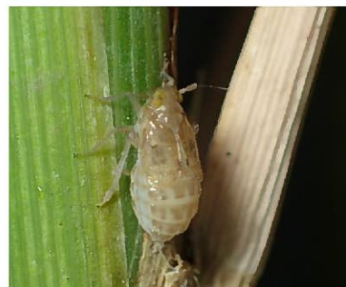
トビイロウンカ （短翅型雌成虫）