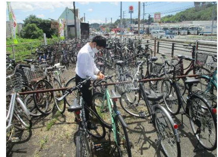
自転車防犯診断の様子